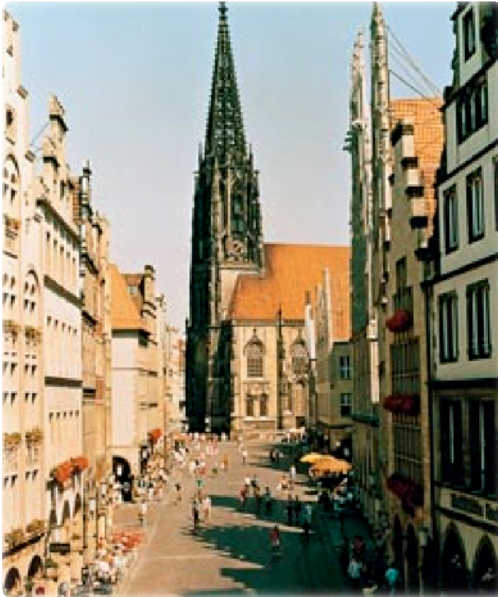
Der Prinzipalmarkt, Münsters „Gute Stube“